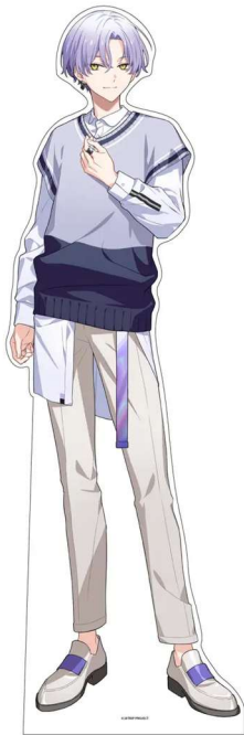
スタンプスポット スタンディイメージ

各スタンプスポットに各区の観光区長のスタンディが登場。各スタンプスポットでスタンディの二次元コードを読み取ると、スタンプ獲得ごとに「観光区長のおすすめスポット紹介レポート画像」を手に入れることができます。