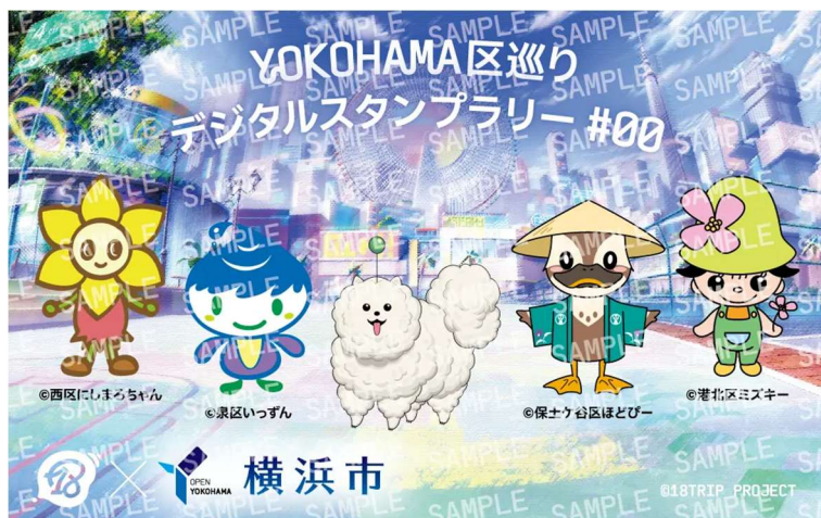
オリジナルステッカーデザイン