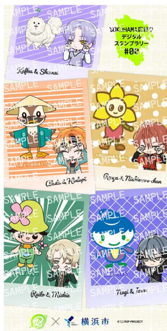
オリジナルスマホ用 待ち受け画像デザイン