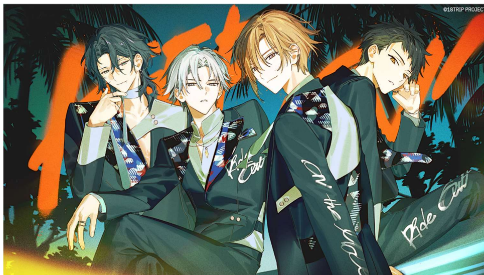
2周年記念イラスト (およ氏描き下ろしの雪風・七基・太緒・夜鷹)

近未来おもてなしアドベンチャー『18TRIP』2周年記念キャンペーンの詳細を公開！