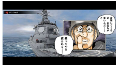
みらいが持つ戦技（左：54口径単装速射砲 右：アスロック）