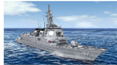
コラボ艦艇「みらい」

コラボでは、漫画『ジパング』に登場する艦艇が 3DCG で再現され「コラボ艦艇」として本作に登場します。さらにコラボ艦艇は、漫画内のワンシーンを再現した「コラボ戦技」を使用することができ、より戦闘を盛り上げてくれる特別な艦艇です。また、2021年6月23日(水)11:59までにログインして頂いた皆様へ、コラボ開催記念としてコラボ艦艇「みらい」をプレゼントしています。